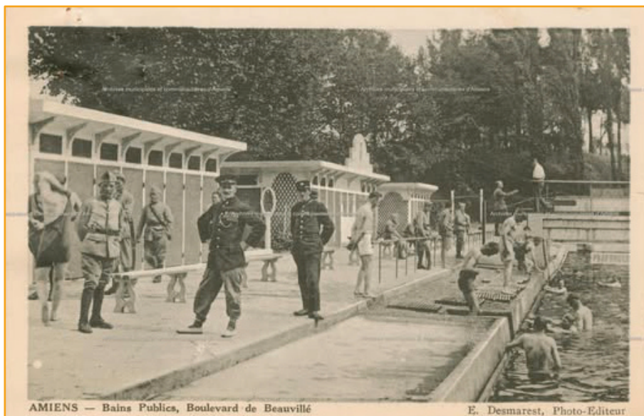
Piscine municipale, boulevard Beauvillé, dite "Les Bains de sable"

⇒ La 2 e piscine d'Amiens est ouverte entre 1918 et 1920, elle aussi en bordure de la Somme et de l'étang Saint-Pierre. Cette piscine est un ensemble de grande qualité en comparaison des installations de l'île aux fagots.