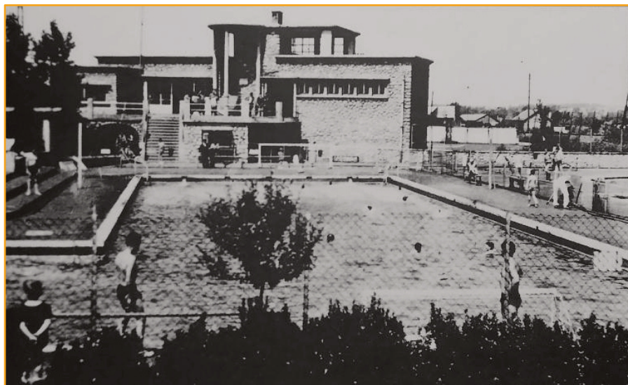
La piscine Léon-Pille dite «La Cheminote» vers 1950

⇒ "Avec son bassin d'apprentissage, sa pataugeoire, son bassin de compétition et sa fosse de plongée, la Cheminote n'accueille plus seulement les cheminots et leur famille : toute la jeunesse amiénoise vient garer son cyclomoteur ou son vélo dans le garage ". ( france3-regions.francetvinfo.fr , 30/03/24)