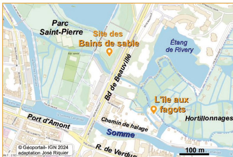
Localisation de l'île aux fagots et des Bains de sable

⇒ "C'est sur ce petit bout de terre maraîchère qu'étaient entreposés les fagots d'osier dont les femmes se servaient pour transporter leurs légumes au marché". (france3-regions.francetvinfo.fr, 30/03/24)