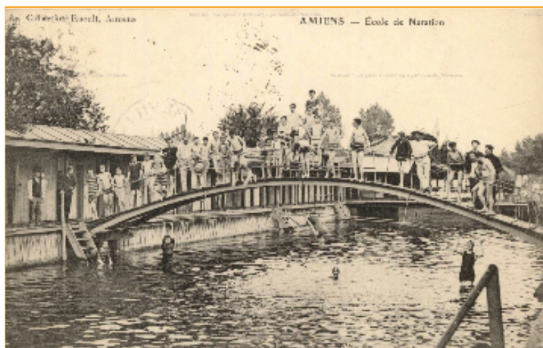
La piscine de l'île aux fagots, une piscine privée Archives municipales et bibliothèque patrimoniale d'Abbeville (CP_PIC_06_0799)

⇒ Au XIX e siècle, des négociants amiénois font construire une piscine dans les hortillonnages pour que les enfants de la bourgeoisie apprennent à nager.