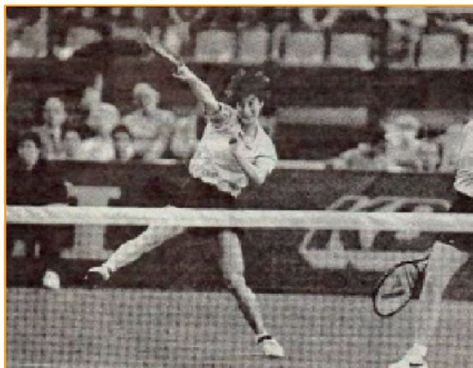
Affiche de la Fed Cup

Réalisée par l'agence de communication Grand Nord