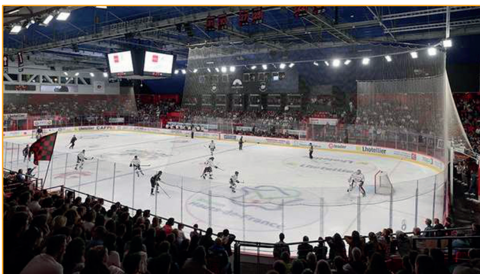
La grande patinoire pendant un match des Gothiques JDA 1100, 4/11/2024

⇒ Une des particularités de la grande patinoire du Coliseum, c'est que c'est une salle qui peut se transformer pour accueillir d'autres sports.