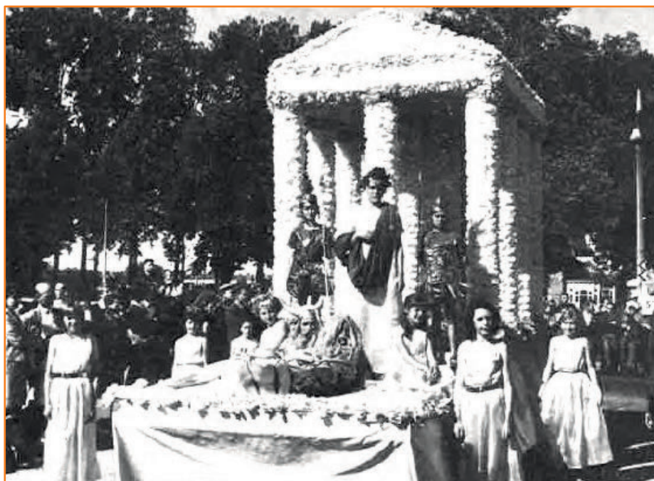
“Triomphe romain” : char du corso fleuri organisé par la Société des amis du zoo (années 1960)

⇒ Ainsi, en 1968, le zoo compte environ 70 espèces allant du lion à l'ours polaire, en passant par la girafe, le chimpanzé et le crocodile. Le parc accueille aussi 21 grands carnivores.