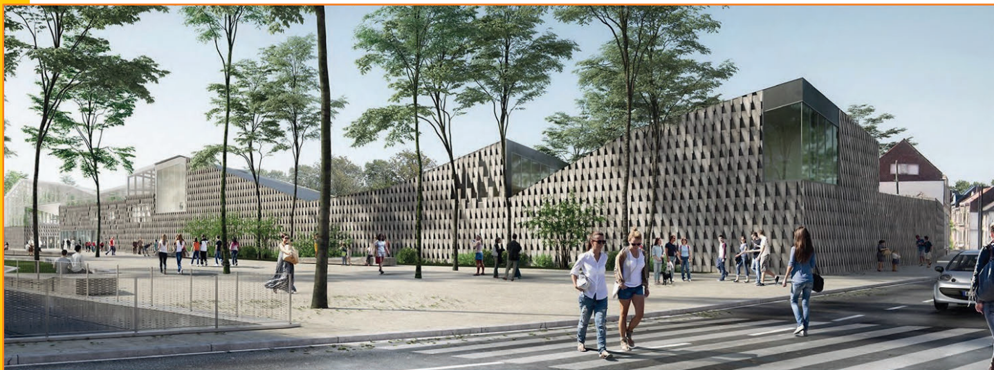
La nouvelle esplanade ouverte sur la rue du Faubourg de Hem Dessin architecte, Copyright Mader-AJOA-AirStudio