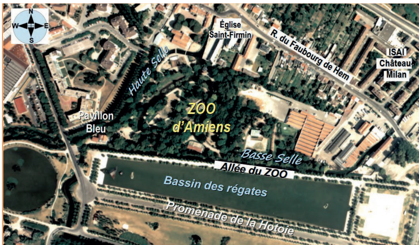
Le zoo et son environnement en 1989 - Photographie aérienne