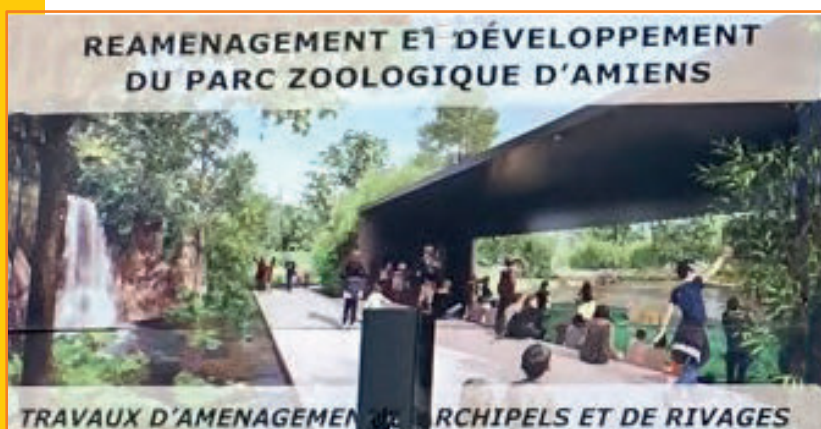
Panneau de présentation des travaux en 2024 La gazette de Picardie @Aletheia Press/DLP

➔ La nouvelle entrée se fait par une esplanade ouverte sur la rue du Faubourg de Hem et le parc de la Hotoie.