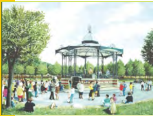
Comité de quartier Saint-Roch/Saint-Jacques