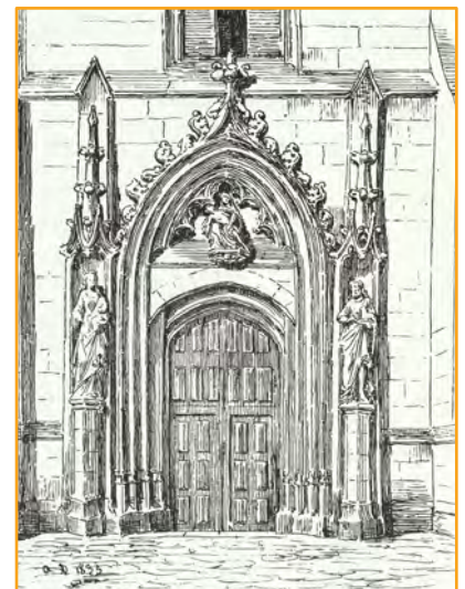
Le portail en 1834 (Dessin des frères Duthoit)

Le cimetière est clos d'un mur. On ne voit pas de tombes monumentales car il s'agit d'un cimetière populaire, à l'image du quartier .