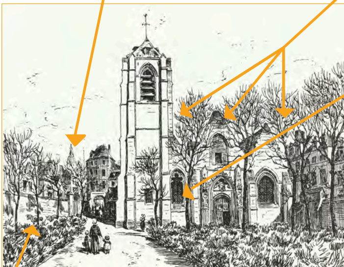
L'église gothique en 1834 (Dessin des frères Duthoit)

On distingue trois toits, trois ouvertures dans la façade, donc trois nefs accolées à l'intérieur.