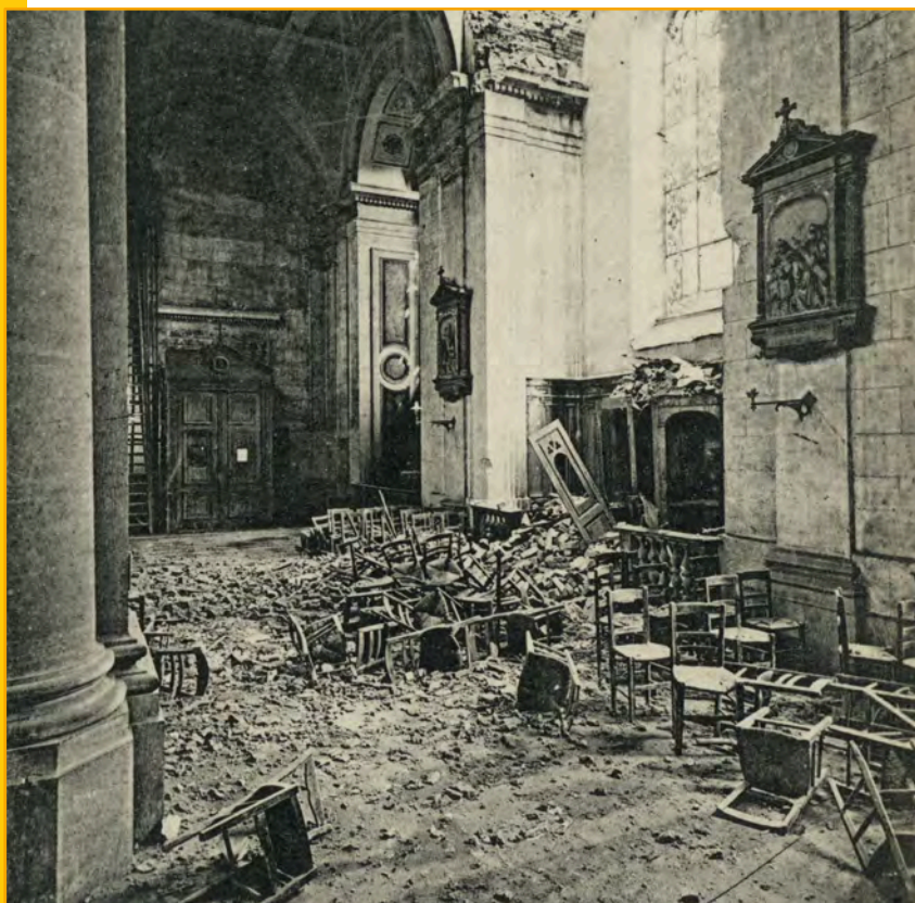
Les dégâts provoqués par le bombardement de mars 1918

⇒ Le nouveau dessin des rues impose de retourner l'édifice qui regarde cette fois vers l'ouest.