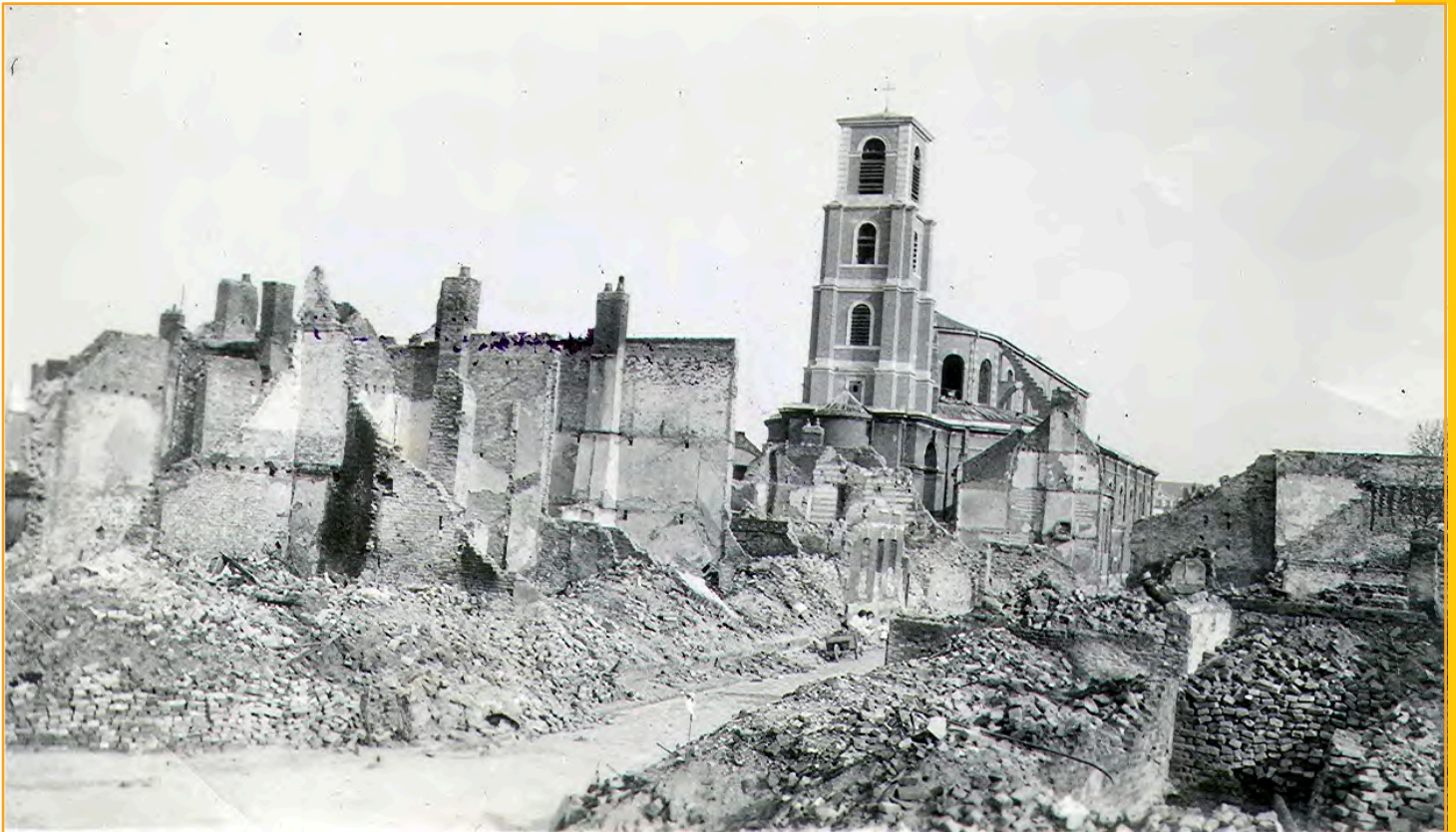
Le quartier Saint-Jacques en mai 1940

⇒ En mai 1940, l'aviation allemande bombarde la ville d'Amiens, les dégâts sont considérables. Le quartier Saint-Jacques et l'église sont fortement touchés.