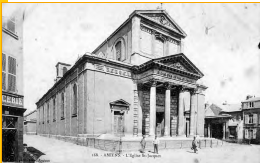
L'église vers 1900

⇒ Après les bouleversements de la période révolutionnaire, la paroisse s'est agrandie et la population d'Amiens augmente rapidement sous l'effet de la révolution industrielle débutante. Le cimetière est déplacé au début du XIX e siècle pour des raisons d'hygiène.