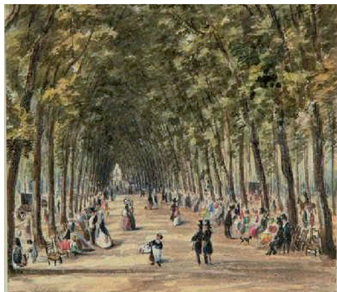
La grande allée du parc de La Hotoie en 1820 (Aquarelle de Duthoit)

Il se trouvait à l'extérieur des remparts de la ville, entre l'abbaye de Saint-Jean-des-Prémontrés au Sud (d'où la rue des Prémontrés et la rue de l'Abbaye) et la chaussée d'Abbeville au Nord (route d'Abbeville actuelle). La Selle serpentait dans cet espace marécageux où poussaient ormes, saules, peupliers, aulnes et tilleuls.