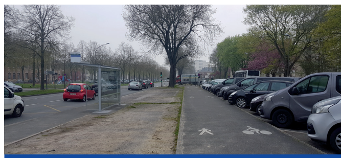
Le boulevard Faidherbe fait partie de l'axe 1

Enfin l'axe 7 , en direction de l'hôpital traversera également le parc par l'avenue Salvador Allende. Mais les principaux aménagements concerneront la route de Rouen. Le plan vélo prévoit aussi un développement de l'offre de stationnement. De nouveaux arceaux arriveront dans le quartier, ainsi que l'installation de consignes à vélo, proposant six places de stationnement sécurisés.