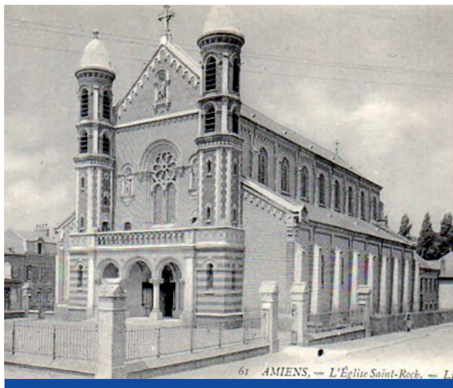
L'église Saint-Roch au début du XX e siècle

La réalisation de la gare Saint-Roch , en 1875, va offrir de belles perspectives de développement avec des lignes en direction de Abbeville, Rouen et Boulogne.