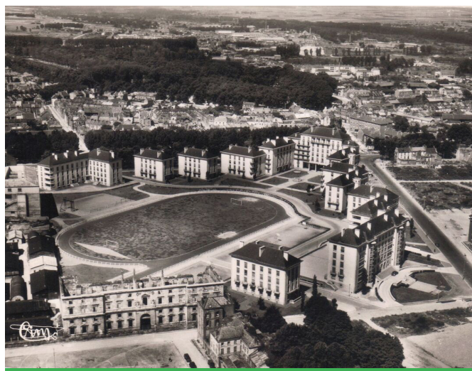
Les ISAI et le stade Thédié dans les années 50

Quel que soit le sens de l'acronyme, ces bâtiments ouvrent un champ d'expérimentation aux innovations dans les modes de construction ; le 2 novembre 1944, le Conseil municipal approuve la construction d'ISAI sur trois sites : Château Milan pour 25 logements, Saint-Pierre pour une trentaine de logements et Boulevard Faidherbe , le plus important, avec 150 logements. Ces derniers encadreront le stade Maurice Thédié, footballeur de l'entre-deux-guerres, mort en déportation. De nos jours, même contraint par la construction du Coliseum d'effectuer une rotation à 90°, ce stade encore très prisé par les scolaires et les sportifs remplit toujours sa vocation originelle.