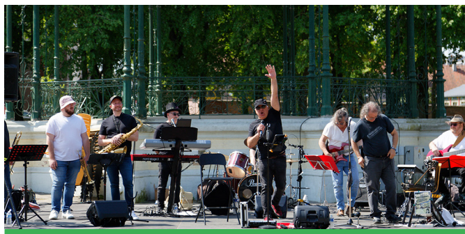
Cardiac Blues en concert le 28 mai dernier

Restez connectés pour plus d'informations dans les prochaines semaines mais retenez déjà ces dates en 2024 : le 28 avril, le 26 mai, le 30 juin (sous réserve) et le 24 septembre.