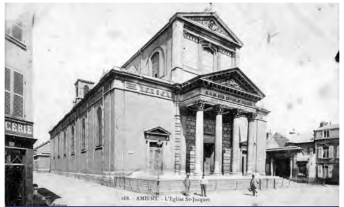
L'église vers 1900 (Carte postale, Archives départementales de la Somme)

La vie de ce nouvel édifice s'avère toutefois agitée : après un premier incendie en 1857, qui détruit tout le mobilier et oblige à reconstruire les voûtes et revoir tout l'aménagement intérieur, l'église est endommagée par les obus allemands en 1918.