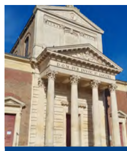
La façade de l'église et les quatre colonnes