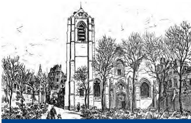
L'église gothique en 1834 (Dessin des frères Duthoit)

Située entre le Centre de secours et le temple, l'église Saint-Jacques, aujourd'hui sise dans le quartier Saint-Germain/Les Halles, fut pendant des siècles au cœur d'une paroisse et d'un quartier Saint-Jacques beaucoup plus étendus. Bâtie au XIII e siècle, cette église gothique est restaurée et agrandie au XIV e et XX e siècles , une fois intégrée à l'intérieur des nouveaux remparts de la cité.