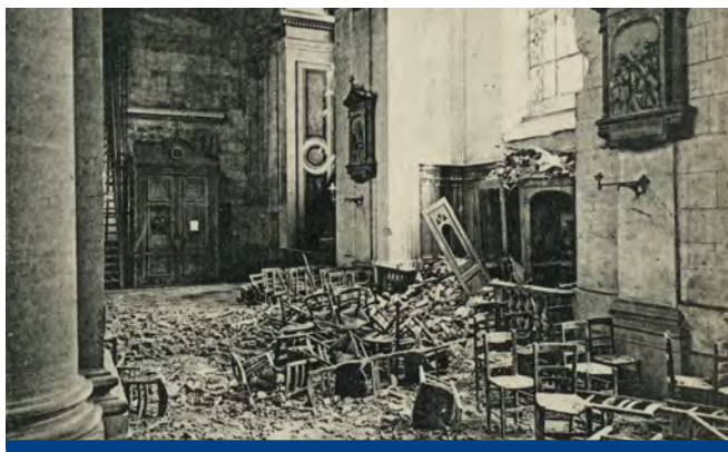
Les dégâts provoqués par le bombardement de mars 1918 (Carte postale, Bibliothèque municipale de Nancy)

Après les bouleversements de la période révolutionnaire, la population d'Amiens augmente rapidement, sous l'impulsion de la révolution industrielle naissante, dont Amiens est l'un des fleurons dans le domaine textile. Le cimetière qui entourait l'église est alors déplacé pour des raisons d'hygiène et l'église intégralement reconstruite et agrandie .entre 1837 et 1841 selon un plan d'Auguste Chussey , dans le style néo-classique alors en vogue à l'époque et dans une orientation inédite vers l'est, pour répondre à la contrainte d'un nouveau plan d'urbanisme.